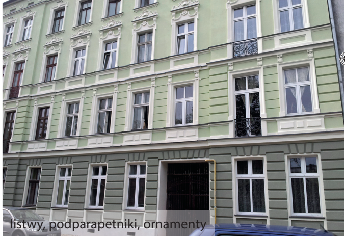
listwy, podparapetniki, ornamenty