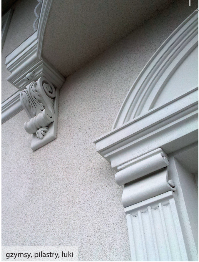
gzymsy, pilastry, łuki